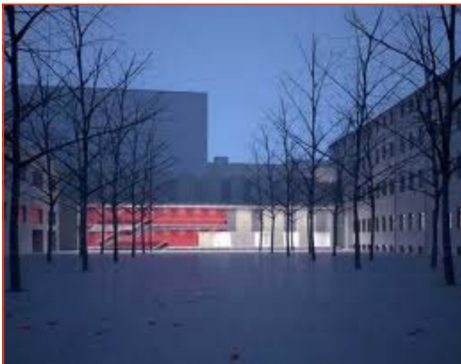
Istituto Gonzaga: il nuovo Centro Sportivo Polifunzionale